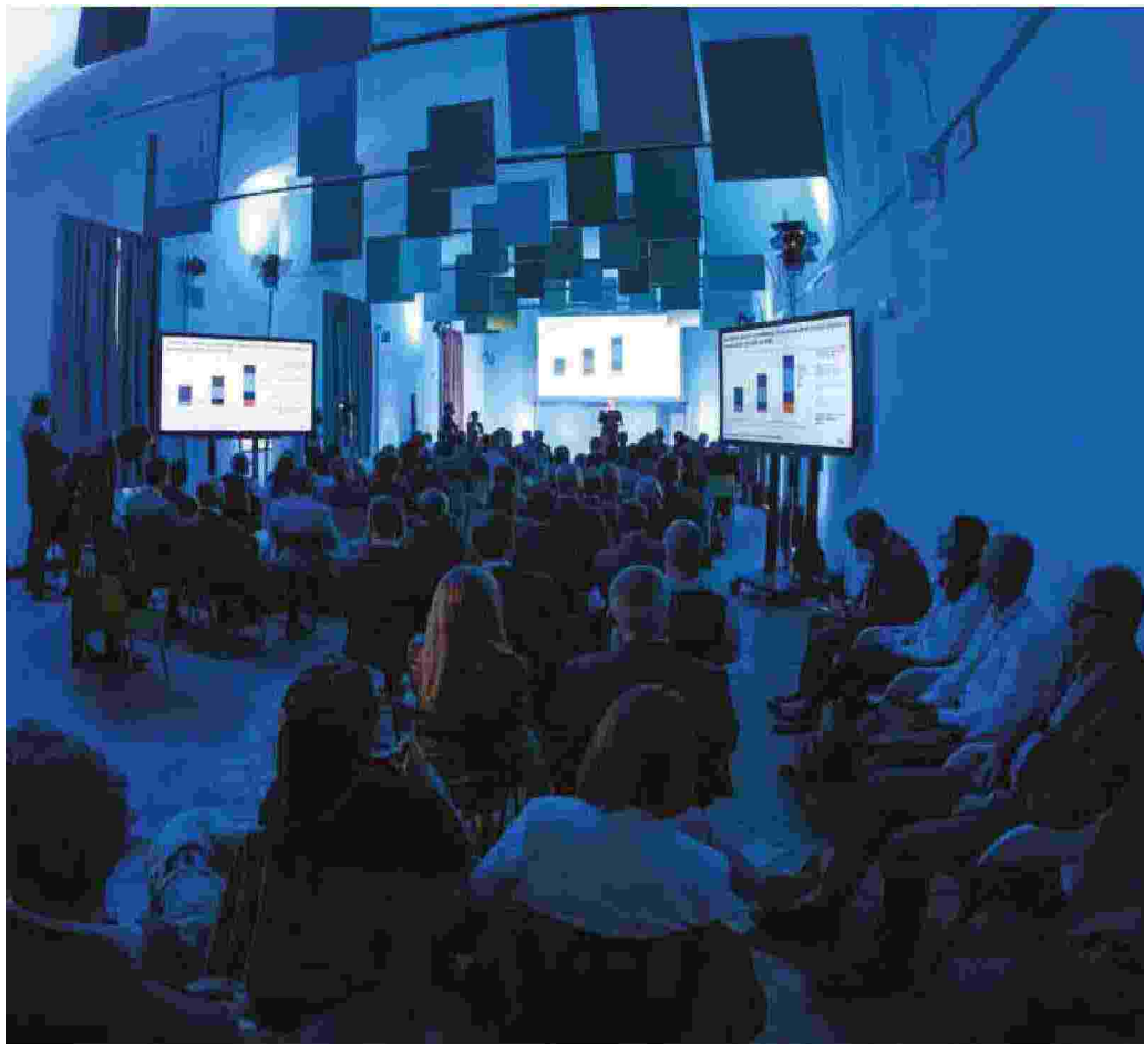
Un momento dell'edizione 2023 dell'Italian Insurtech Summit

stare, gestire e aggiornare le proprie polizze direttamente online, con un semplice click. Per fare alcuni esempi: la startup Yolo è stata la prima insurtech italiana a fornire micro-assicurazioni e assicurazioni on demand completamente digitali per offrire micropolizze digitali istantanee, come quelle fatte con Helbiz, provider di bici e scooter elettrici, per fornire prodotti assicurativi ad hoc pensati per coprire gli imprevisti che possono sopraggiungere durante un viaggio. Tuttavia, la vera svolta dell'insurtech a mio avviso non risiede solo nell'innovazione di prodotto, ma anche nella capacità di broker ed agenti di efficientare e ottimizzare l'offerta ai loro clienti grazie alla tecnologia.